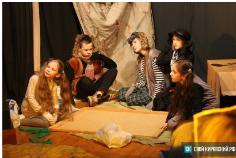
«До свидания, овраг»