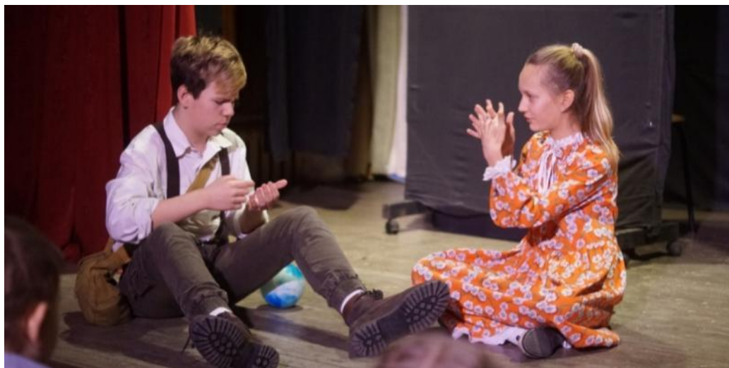
«Не слышу, но с тобой»