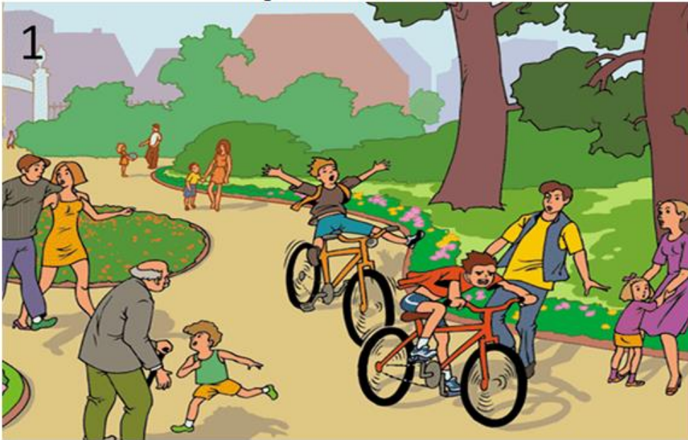
Картинки для пазлов