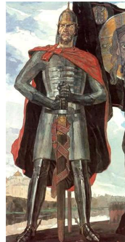
Александр Невский П.Д. Корин 1942 г.