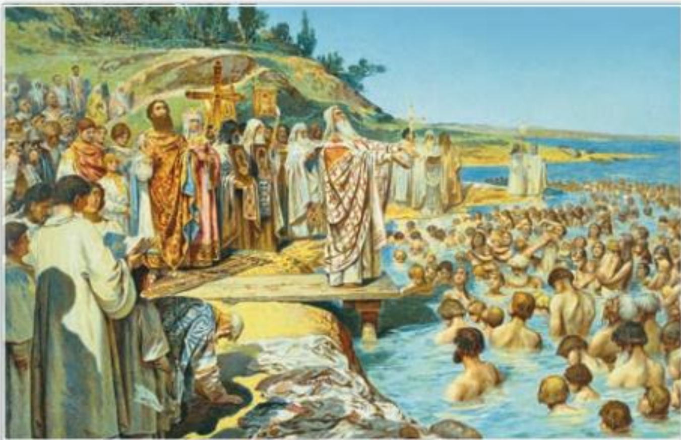
Крещение киевлян. Художник К. Лебедев. 1898 г.

Какое из свершений князя Владимира можно считать наиболее значимым для российской истории?