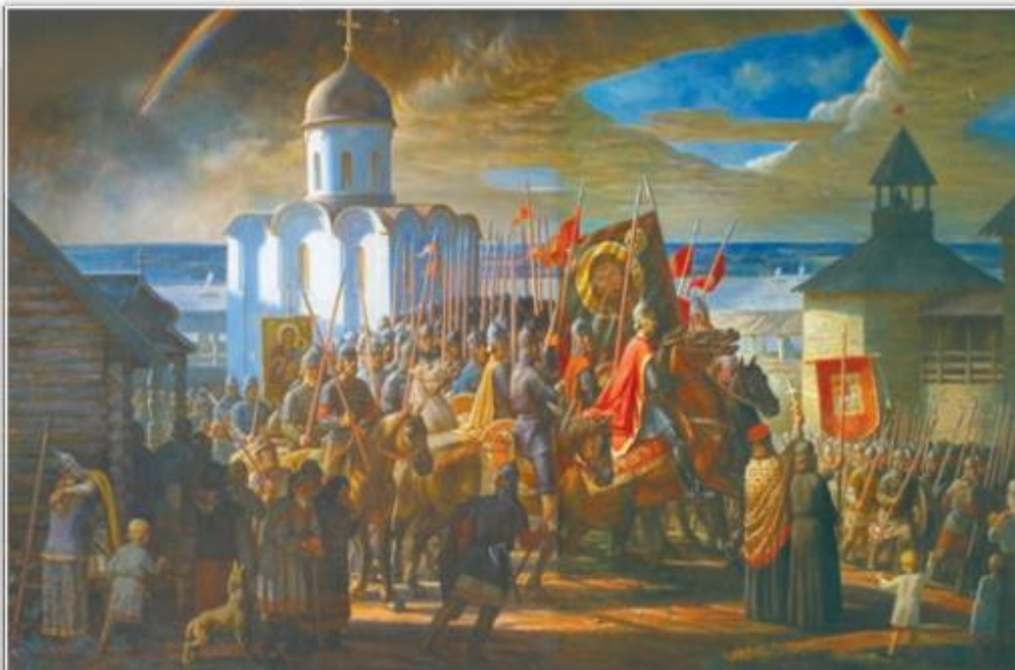
Александр Невский. Художник А. Булдаков. 2007 г.

Какое значение для судьбы русских земель имела борьба Новгорода с западными завоевателями?