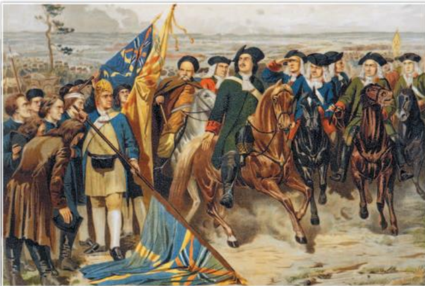
«Полтавский бой. Шведы преклоняют знамёна перед Петром I. 1709 г.». Художник А. Кившенко

Почему Полтавская битва стала решающим сражением Северной войны?