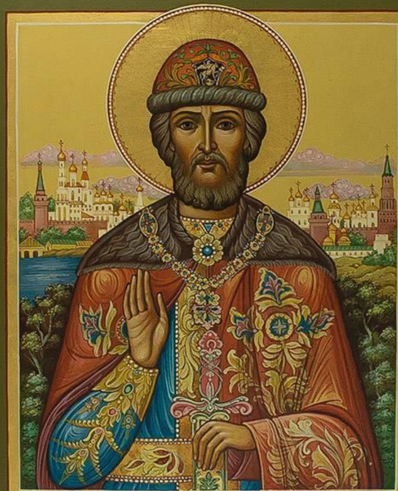
СВ. БЛГВ. КНЗЪ ДМИТРИЙ ДОНСКОЙ.