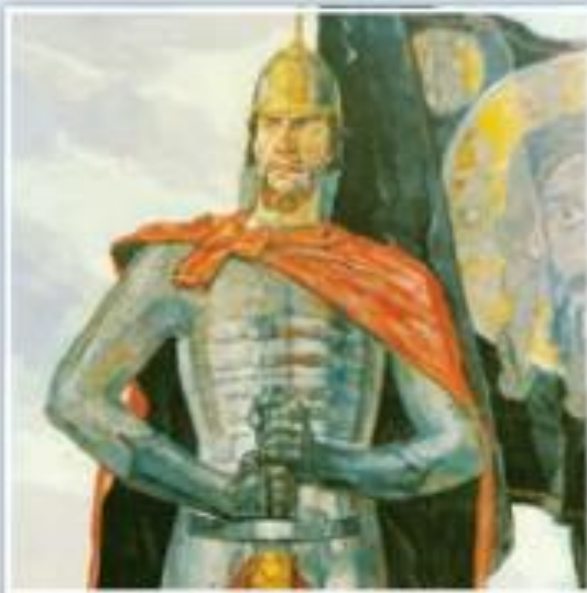
Александр Невский. Фрагмент. Художник П. Корин. 1942 г.