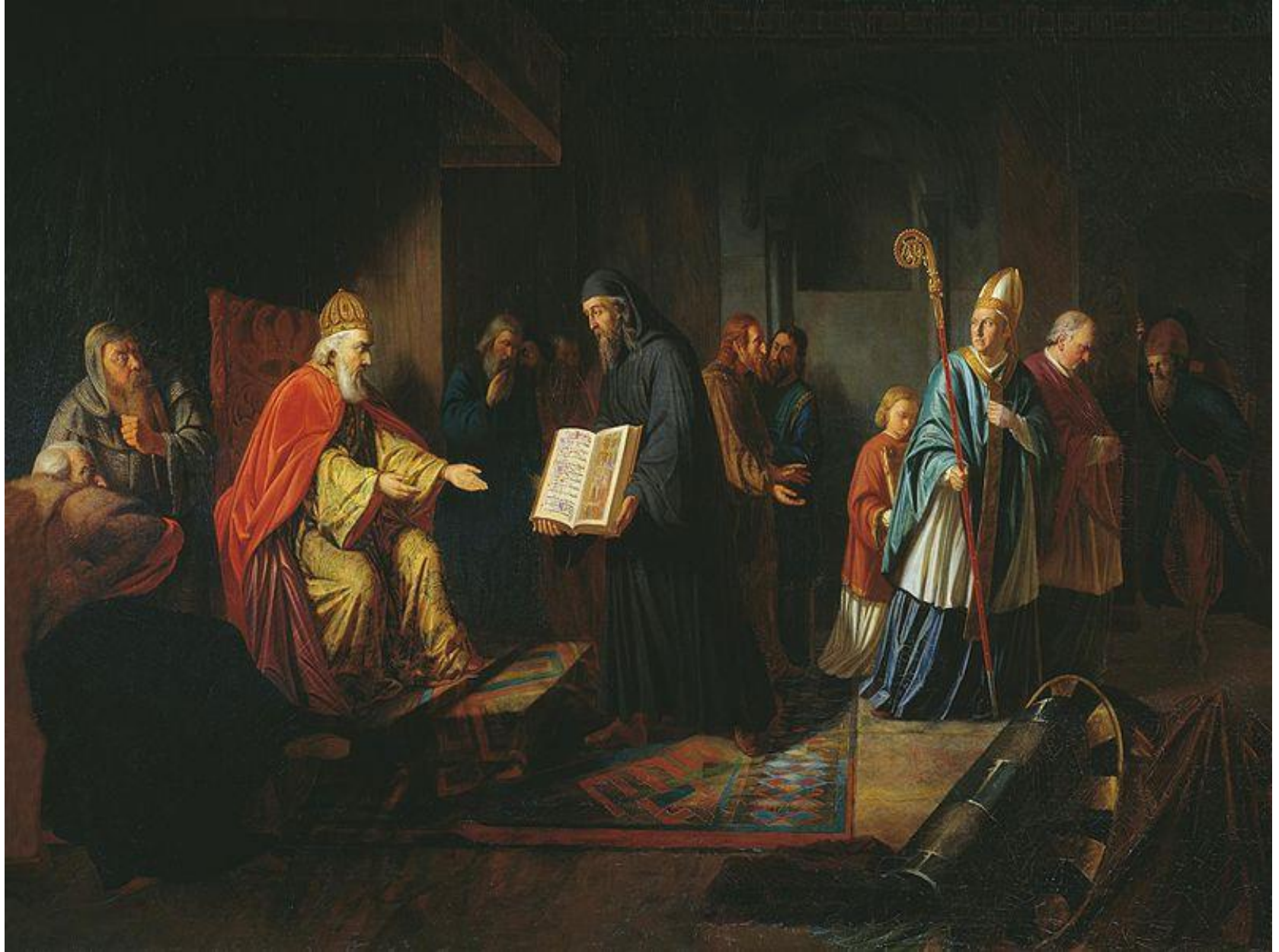
И. Е. Эггинк. Великий князь Владимир выбирает веру. 1822 г.