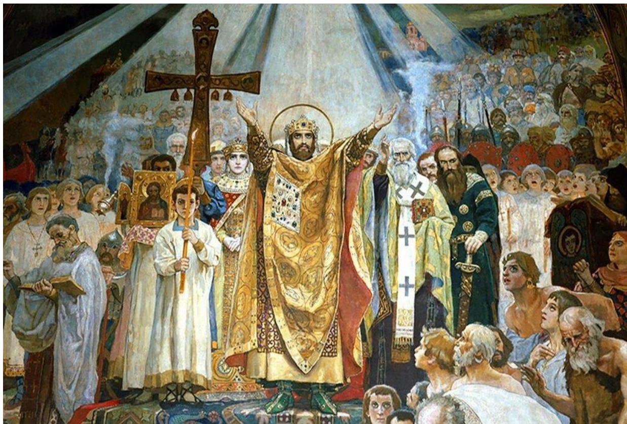
«Крещение Руси». Фреска. В. М. Васнецов